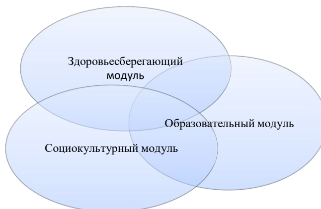
Рисунок 1. Схема взаимодействия модулей программы

С целью достижения максимального результата в течение всего основного этапа коллективы участников программы живут активной внутренней жизнью: проводят отрядные и межотрядные коллективно-творческие дела.